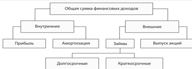
Рис. 7. Источники финансовых доходов предприятия

Анализ структуры заемного капитала. Большое влияние на ФСП оказывает состав и структура заемных средств, т.е. соотношение долго-, средне- и краткосрочных финансовых обязательств. Из данных табл. 6 следует, что за отчетный год сумма заемных средств увеличилась на 18430 тыс. руб., или на 23,3%. Произошли существенные изменения и в структуре заемного капитала: доля долгосрочных обязательств уменьшилась, а краткосрочных соответственно увеличилась на 1,69%.